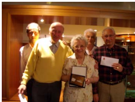
Les trois premiers du masters