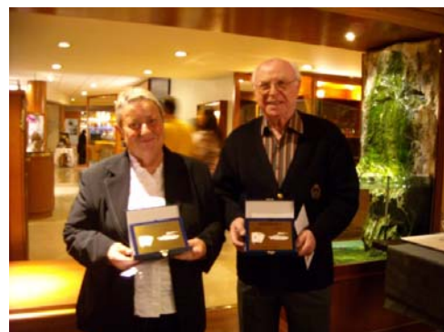
Les premiers 3 o et 4 o séries